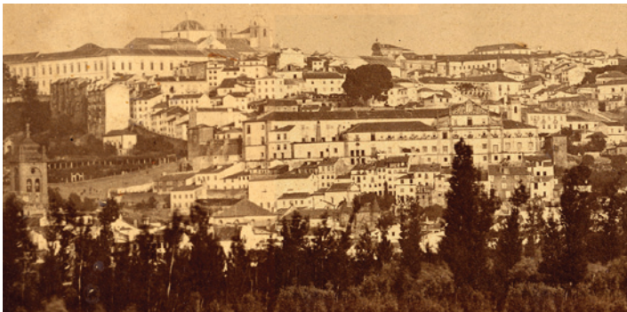
Figura 2 – Colégio de Santo Agostinho e a Torre de Anto.