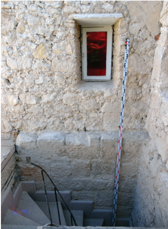
Figura 8 – Piso 04: pormenor do troço em alvenaria de pedra em perpianho da fachada N.