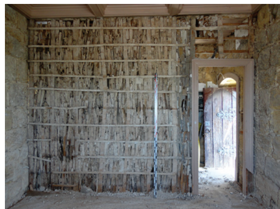
Figura 7 – Piso 03: pormenor do aparelho construtivo designado por “gaioleiro”.