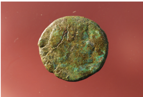
Figura 5 – Moeda romana em liga de bronze.