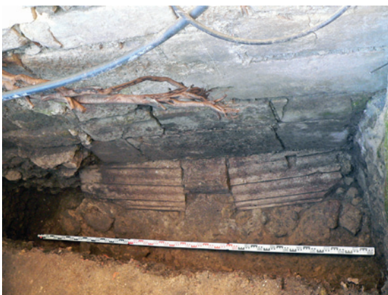
Figura 6 – Pedras fundacionais constantes no alçado S.