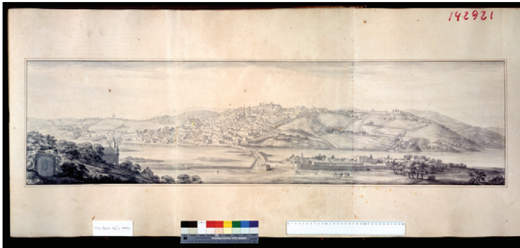
Figura 1 – Excerto da ilustração da autoria de Pierre Baldi (1669), sendo a Torre de Anto a última à esquerda.