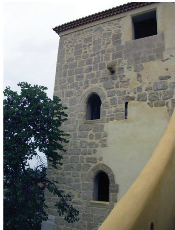
Figura 9 – À esquerda o alçado N e O, e à direita o alçado S da torre de Anto, no decurso dos trabalhos de recuperação.