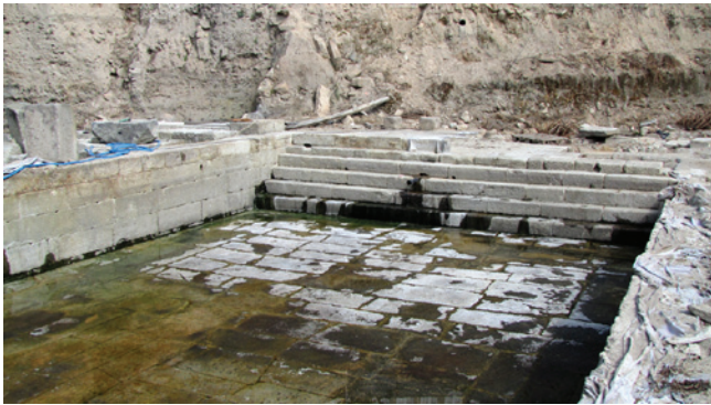
Figura 6 – Piscina A, lado Norte.