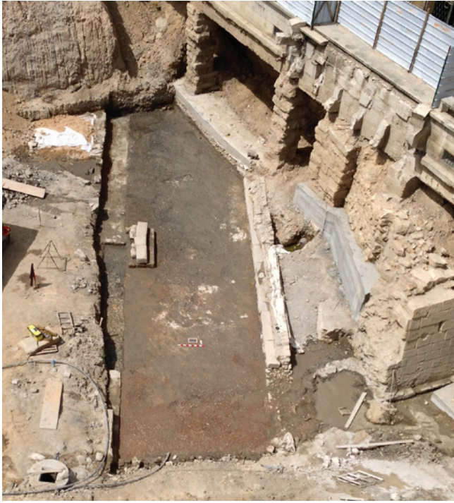
Figura 5 – Sala 1.