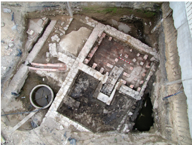
Figura 7 – Hipocausto.