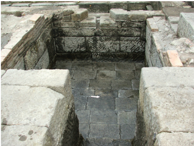
Figura 3 – Piscina C: vista do arranque da abóbada.