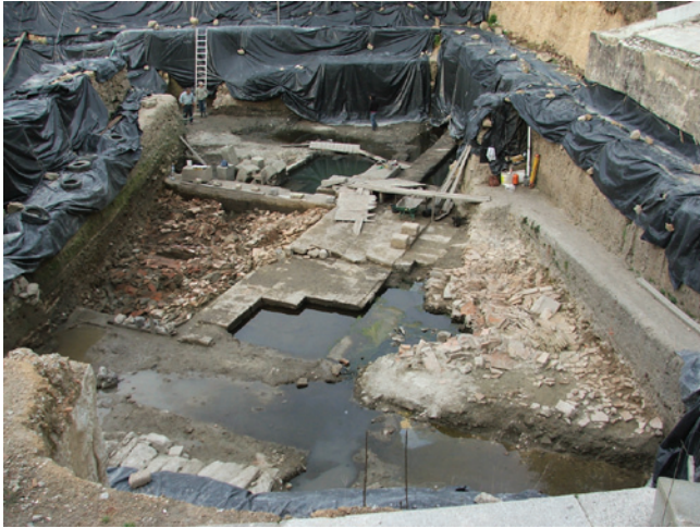
Figura 2 – Derrube da abóbada sobre a piscina A e a sala 2.