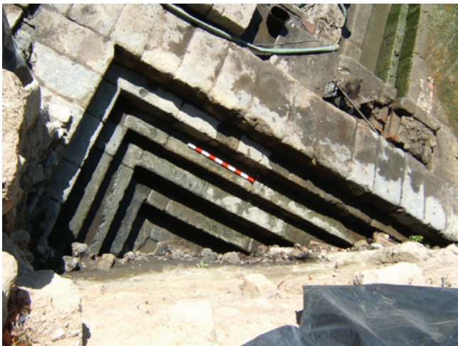
Figura 4 – Piscina B.