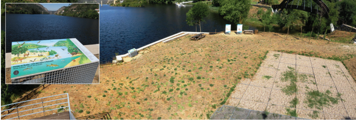
Figura 6 – Vista geral da zona de reserva arqueológica, com o detalhe do painel panorâmico fronteiro ao rio, sobre a fauna (terrestre e aquática) actual.