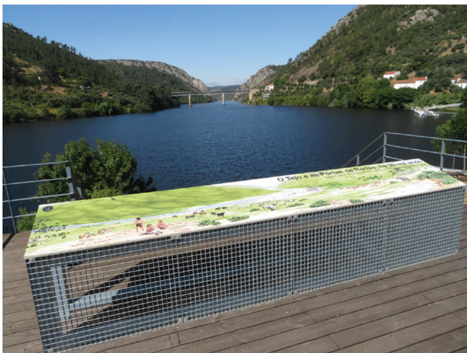
Figura 8 – Vistas nocturna e diurna da zona de musealização in situ , pondo em evidência a estrutura polivalente construída para a proteger, servir de suporte para auditório e de mirante 4 superior de observação de todo lo local e região envolvente, com as Portas de Ródão em fundo.