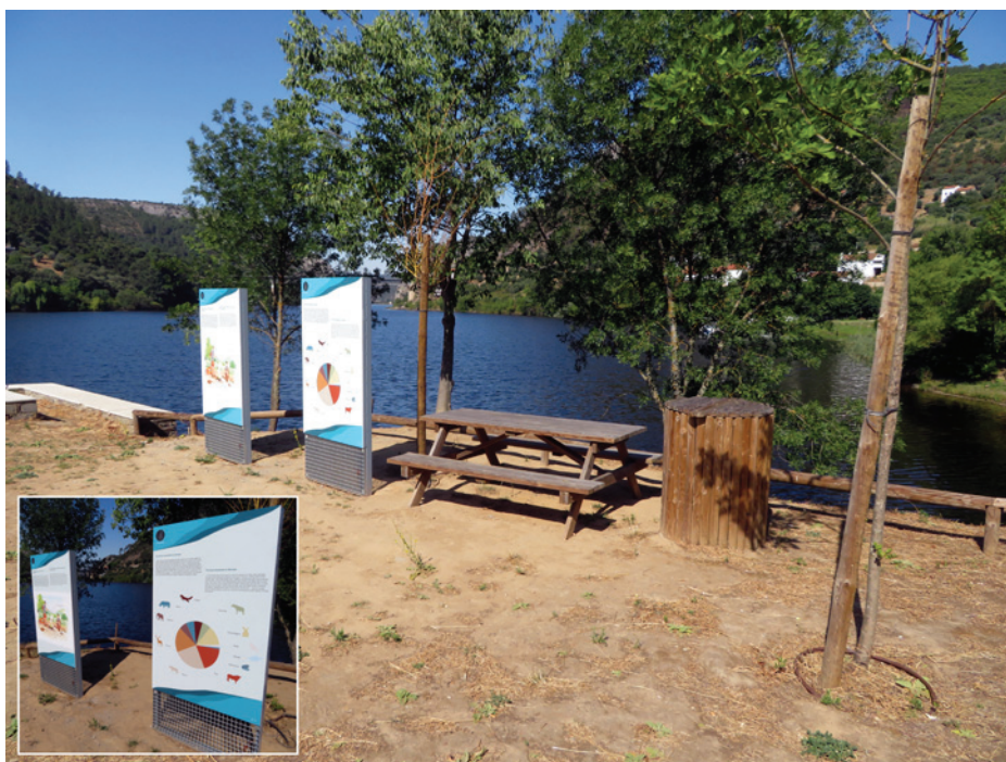
Figura 5 – Conjunto de painéis e equipamentos sociais na zona de observação e descanso.