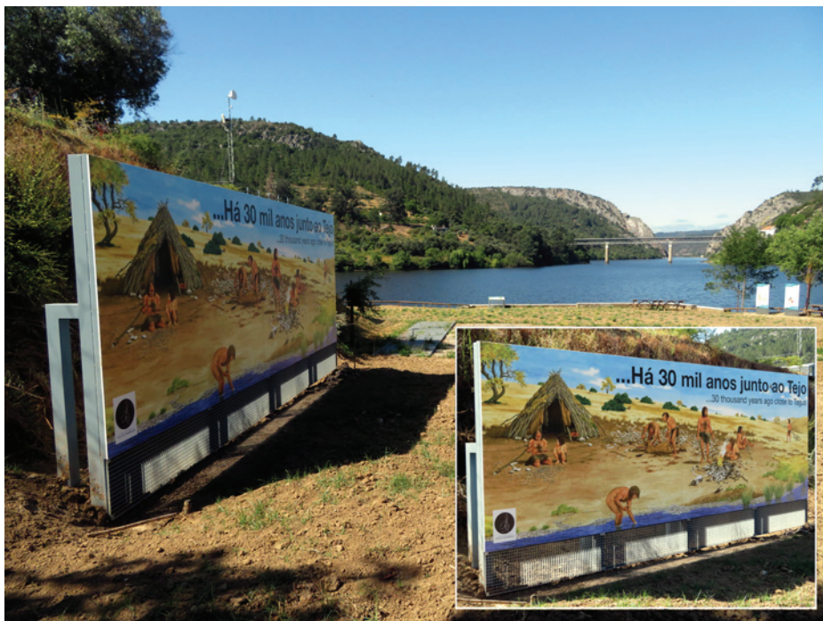
Figura 4 – Painel P3. Título “ Há 30 mil anos... ”. Desenho de reconstituição de um acampamento de Néandertais, realizando atividades quotidianas. Dimensão da impressão 7 x 2,5 m.