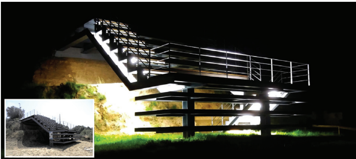
Figura 7 – Vistas nocturna e diurna da zona de musealização in situ , pondo em evidência a estrutura polivalente construída para a proteger, servir de suporte para auditório e de mirante superior de observação de todo o local e região envolvente, com as Portas de Ródão em fundo.