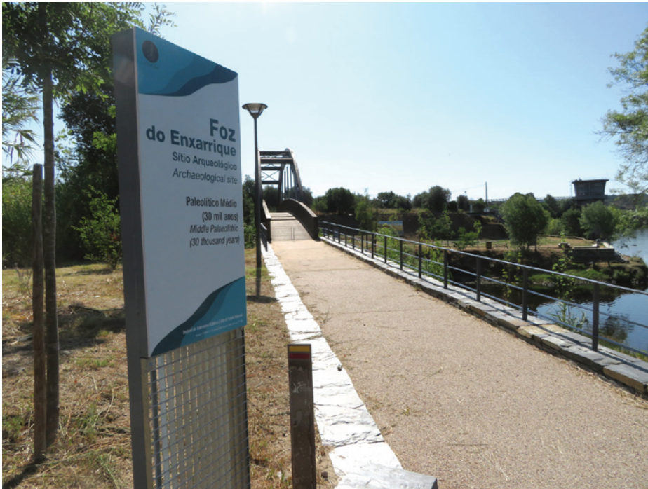
Figura 2 – Painel de introdução, no acesso à ponte pedonal sobre a ribeira do Enxarrique.