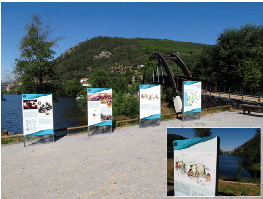
Figura 3 – Conjunto de painéis, na zona de receção. Ficha técnica nesta como nas seguintes imagens: Conteúdos / Coordenação: Luís Raposo; Desenho Gráfico: Patricia Bôto; Ilustração: Marcos Forte; Estruturas Expositivas: MB-Arquitectos; Promotor: Município de Vila Velha de Ródão.