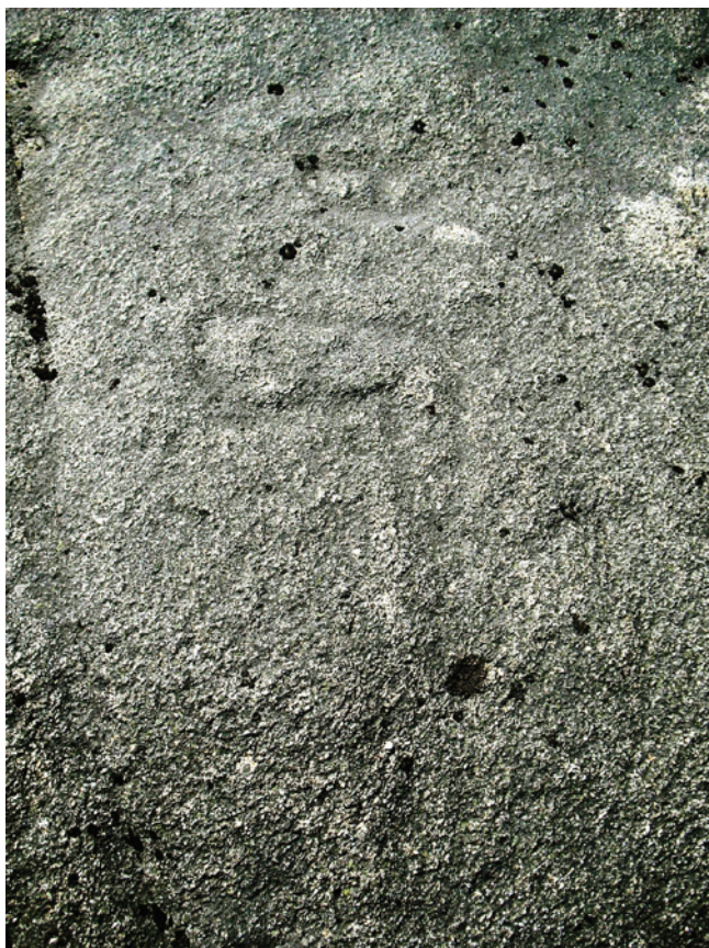
Figura 1– Em cima: alabarda da Costa da Areira 1 e possível escudo. Em baixo: machado de gume alargado encabado, associado a círculo segmentado.