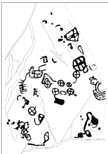
Figura 2 – Diversos círculos segmentados encontrados na Laje da Churra, associados a eventuais paletas circulares e retangulares, zoomorfos, um antropomorfo, covinhas e um semicírculo concêntrico (seg. Santos, 2014).