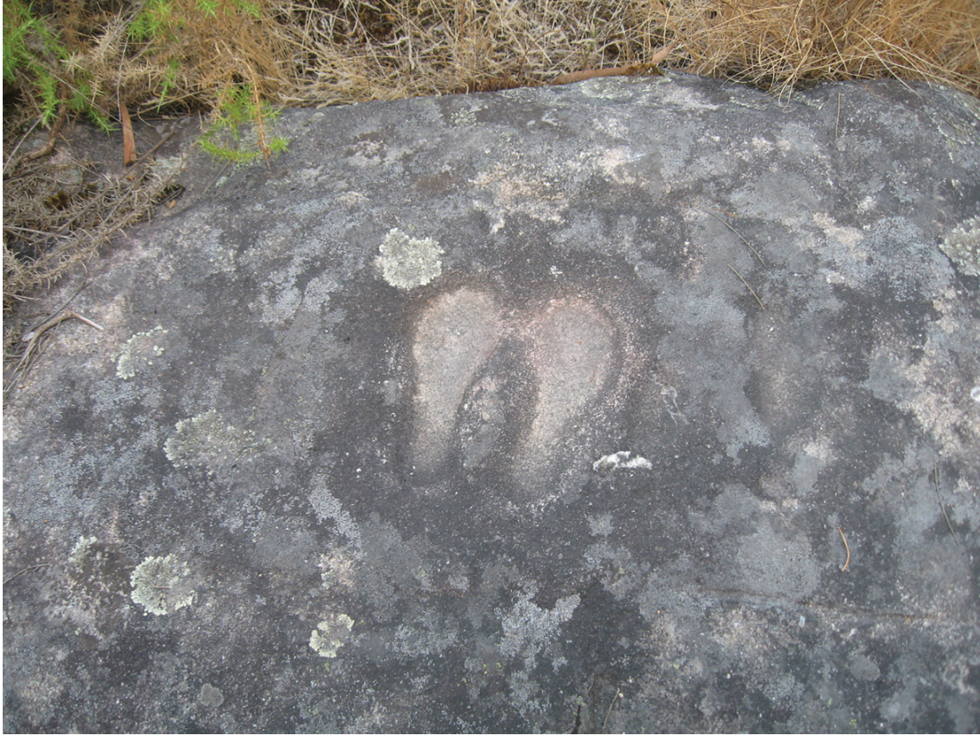
Figura 6 – Podomorfos da Quinta dos Laranjais, Guimarães (seg. Cardoso, 2015).