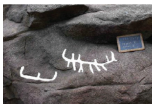
Figura 3 – À esquerda: alguns barquiformes da Laje da Churra (seg. Santos, 2014). Estes associam-se a dois zoomorfos, a, pelo menos, uma paleta, entre outros motivos de difícil interpretação. O barquiforme maior tem uma covinha no topo. À direita: barquiformes de Santo Adrião, pintados sobre o suporte digital (seg. Santos-Estévez e Bettencourt, 2015, adaptado).