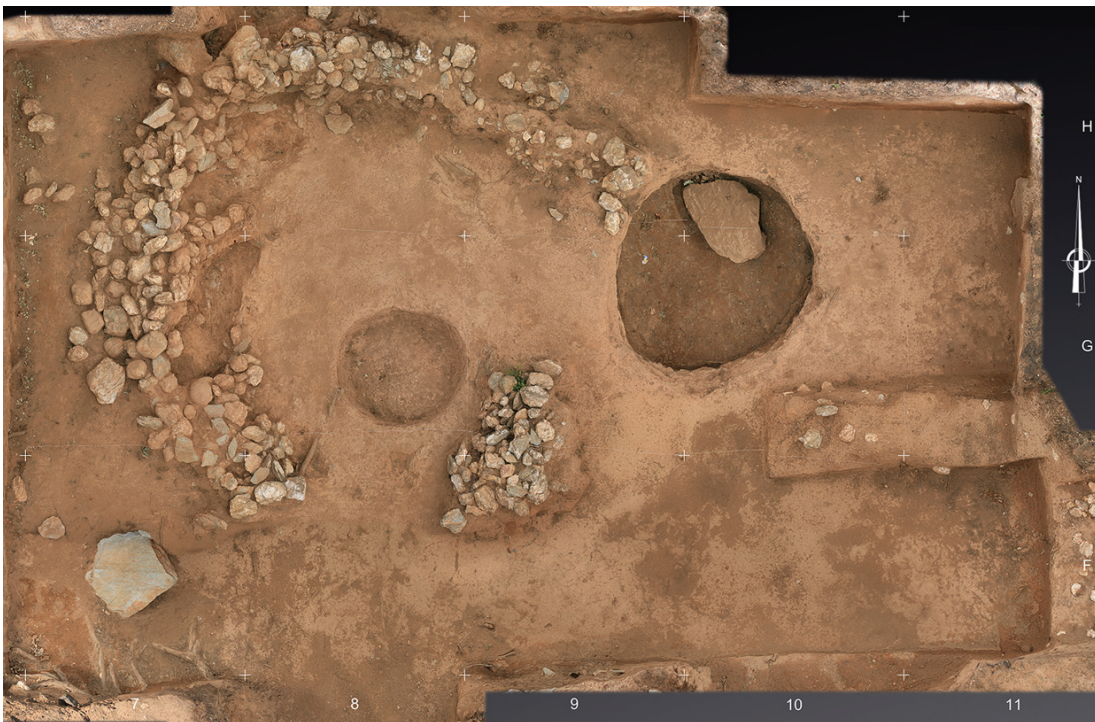
Figura 3 – Área central da Mamoa 3 do Taco. Levantamento tridimensional (Hugo Pires). 2015.