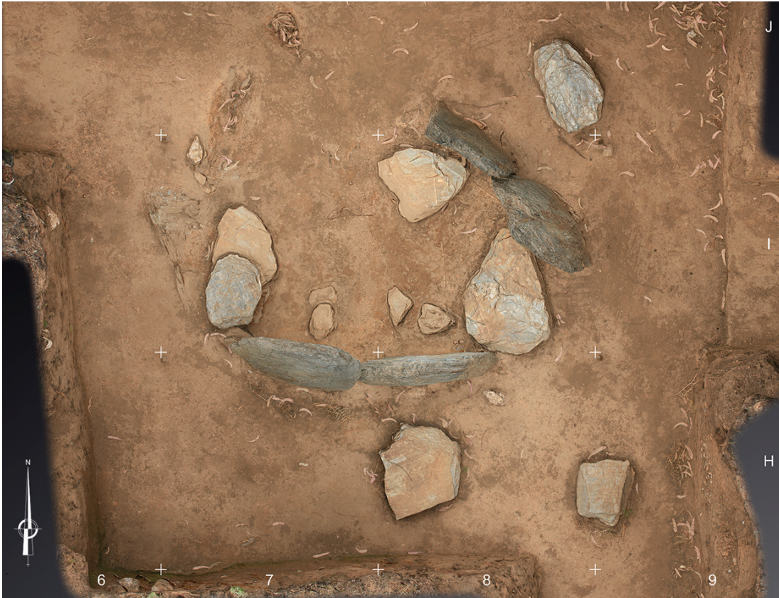
Figura 2 – Câmara funerária da Mamoa 1 do Taco. Levantamento tridimensional (Hugo Pires). 2015.