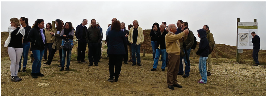
Figura 1 – Visita guiada ao Forte da Ajuda Grande inserida no II Encontro sobre Arqueologia e Museologia das Guerras Peninsulares, em 21 de outubro 2016.

WALSH, Kevin – The Representation of the Past. Museums and heritage in the post-modern world . London: Routledge, 1992.