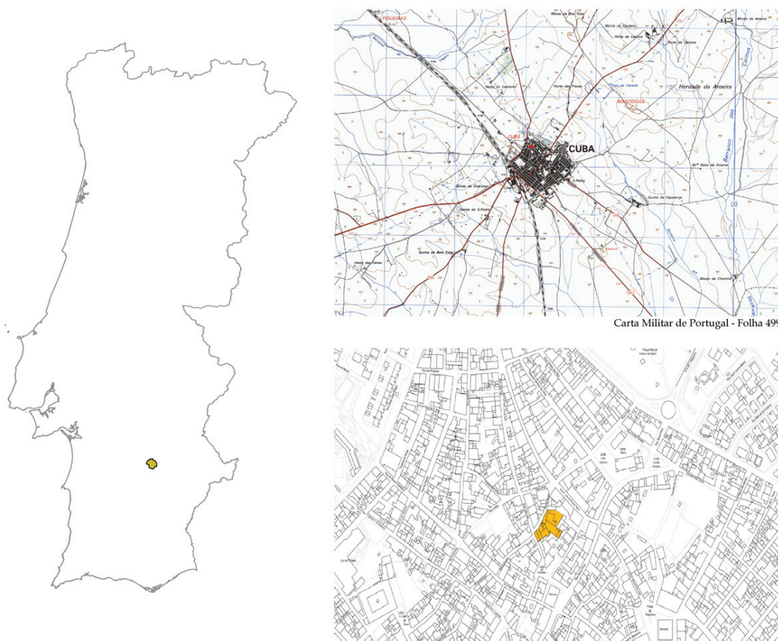
Figura 1 – Localização geográfica e cartográfica da Casa Fialho de Almeida.

SILVA, Joaquim Palmilha da (2000) – A Casa de Fialho em Cuba. Boletim da Associação Cultural Fialho de Almeida , n.º 2. Cuba: Associação Fialho de Almeida, p. 2-13.