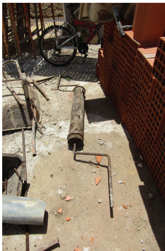
Figuras 7 e 8 – Poço cisterna identificado e sarilho.