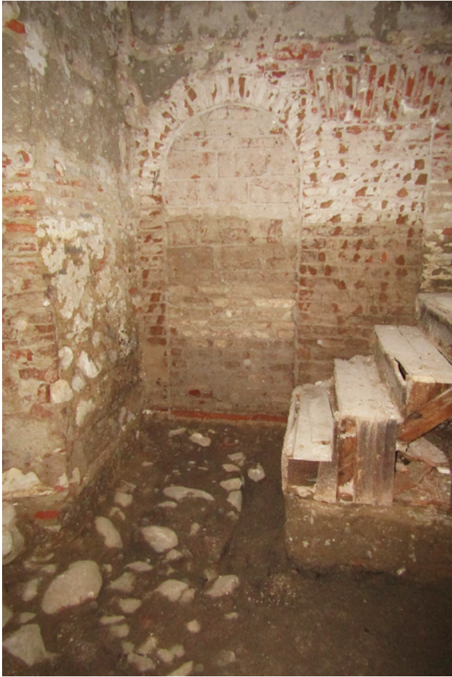
Figura 4 – Compartimento de acesso ao piso superior e terraço, porta entaipada.