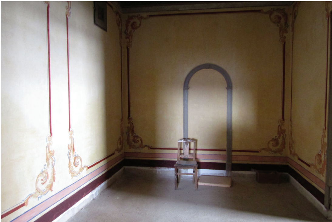
Figura 5 – Escritório de Fialho d'Almeida porta entaipada.