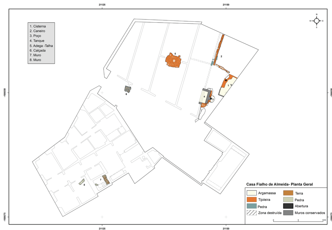
Figura 10 – Planta geral com os novos elementos etnográficos e arqueológicos identificados, durante os trabalhos de acompanhamento arqueológico.