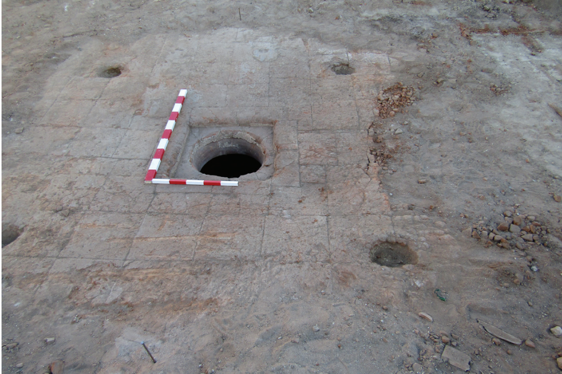
Figura 9 – Dorna identificada no pátio no espaço que será uma adega.