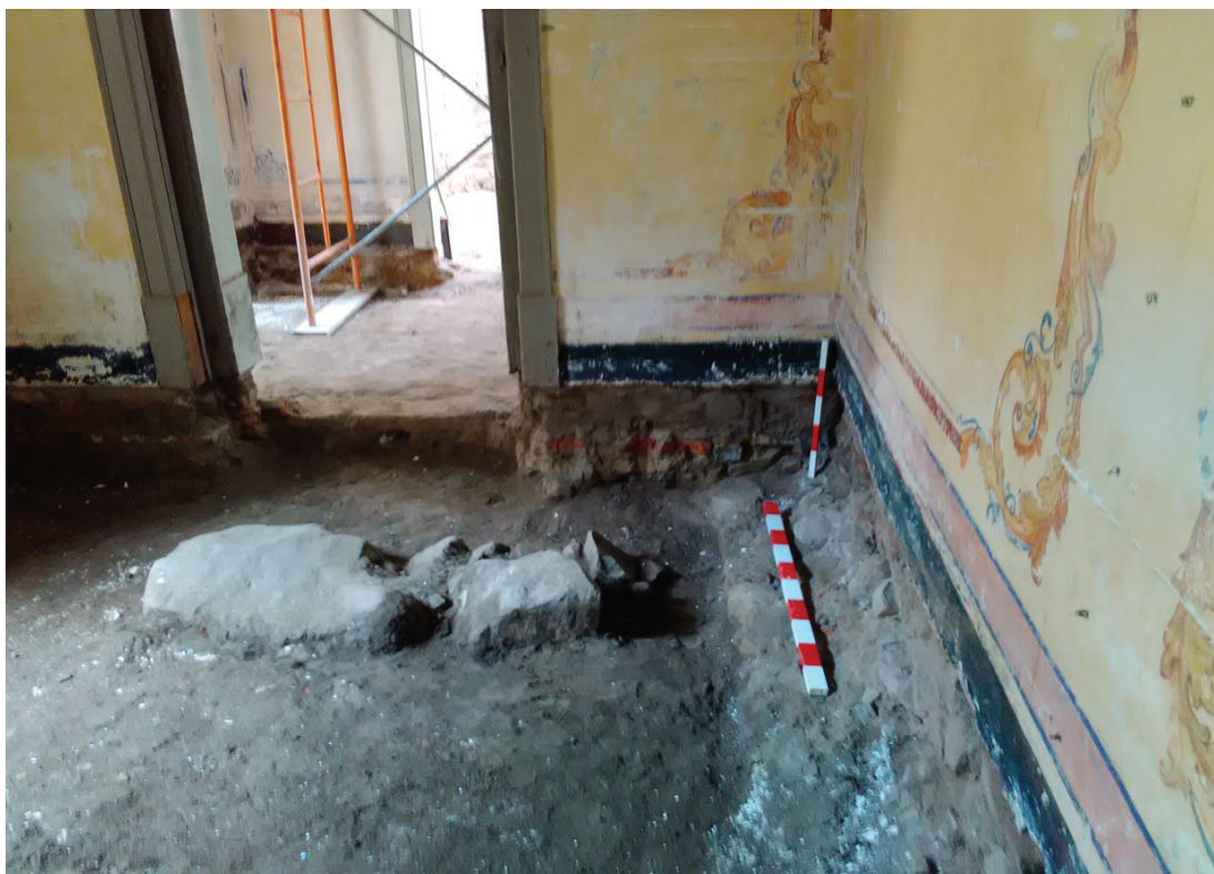
Figura 6 – Muro de uma fase anterior à construção da casa actual do escritor Fialho de Almeida.