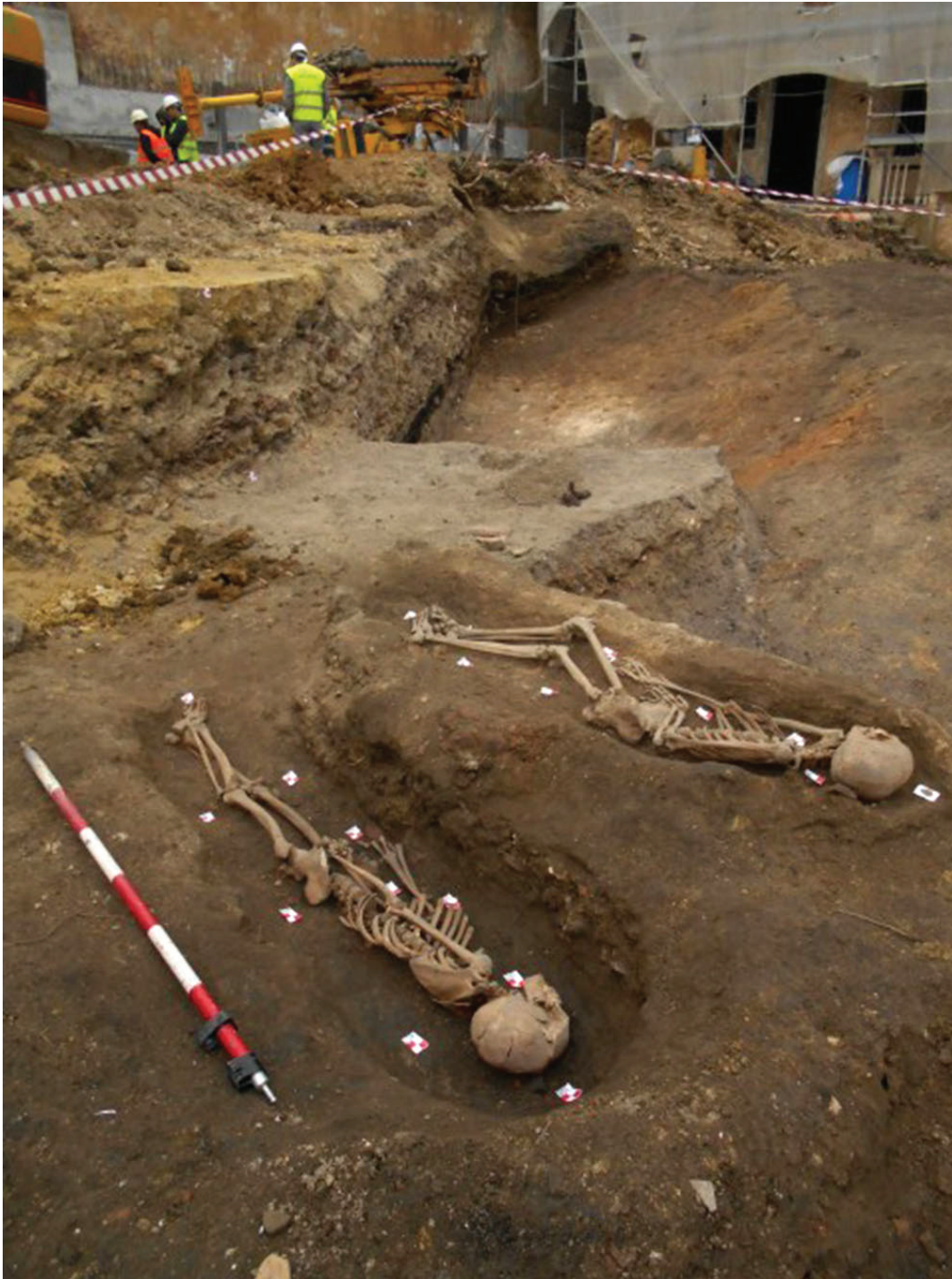
Figura 3 – Plano geral dos indivíduos in situ da necrópole islâmica.