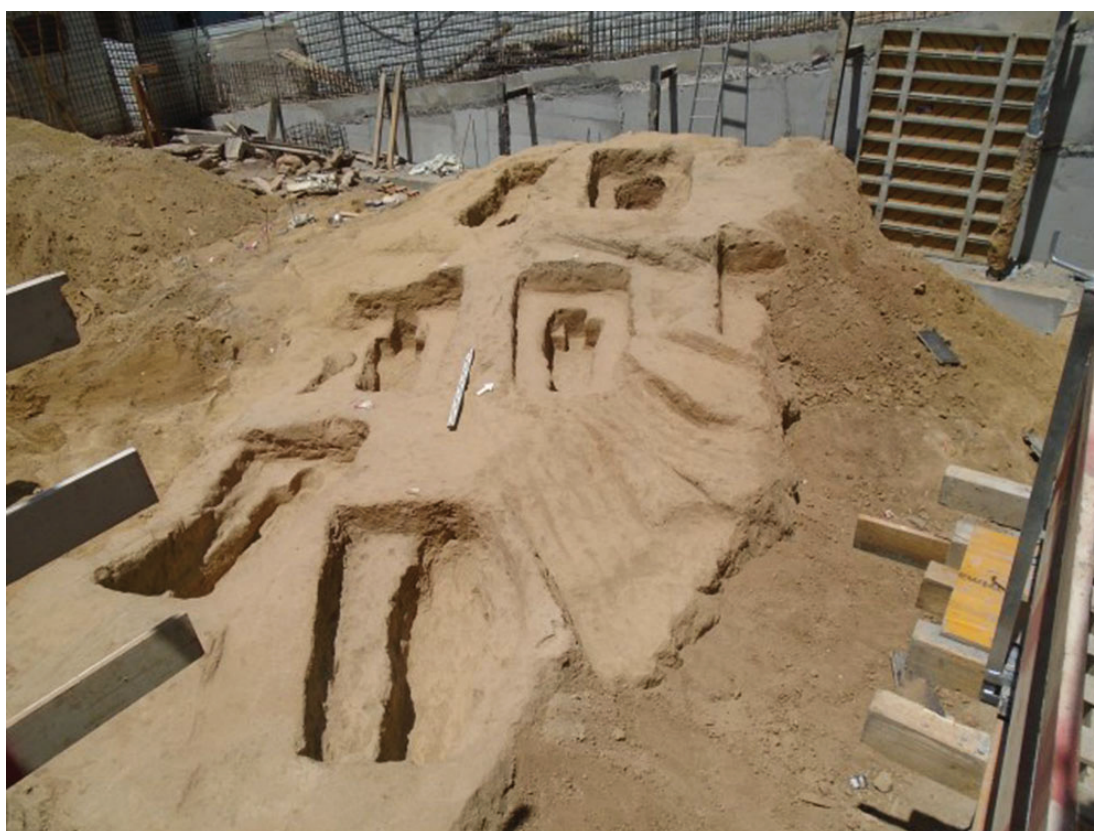
Figura 1 – Vista geral da intervenção da necrópole judaica (século XV).

WASTERLAIN, Rosa Sofia (2000) – Morphé: Análise das proporções entre os membros, dimorfismo sexual e estatura de uma amostra da colecção de esqueletos identificados do Museu Antropológico da Universidade de Coimbra . Dissertação de Mestrado em Evolução Humana. Coimbra: Departamento de Antropologia, Faculdade de Ciências e Tecnologia da Universidade de Coimbra. [não publicado].