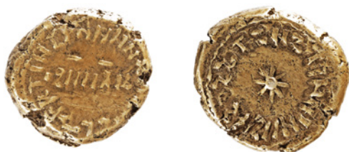
Figura 5 – Dinar, moeda de ouro (MCM 3885) corresponde à primeira espécie cunhada neste metal durante o domínio islâmico no território ibérico – 93 H. / 712 d.C., com legenda em árabe e latim, onde se pode ler «Span[ia]».

À adesão inicial de elementos populacionais indígenas à religião dos vencedores, seguiu-se a conversão em fases posteriores das segundas gerações de moçárabes. Paralelamente à islamização, verificou-se uma arabização (orientalização) por vezes reivindicada para promoção social.