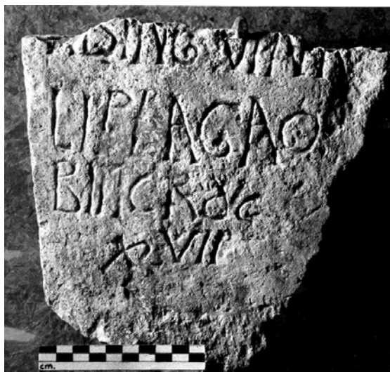
Figura 2 – Inscrição funerária referente a uma morte atribuída à peste bubônica em Córdoba em 609 (CIL II2/7, 00677; tab. 19, 7) 2