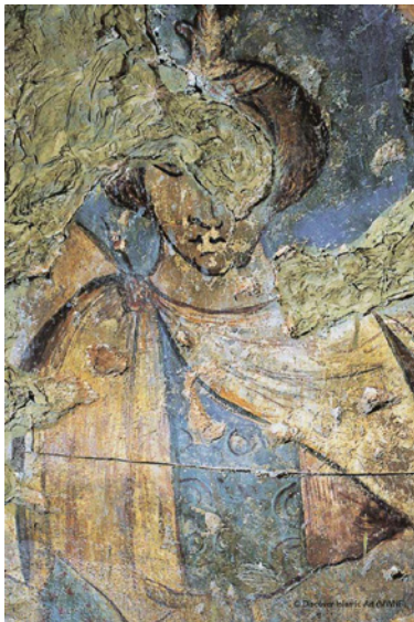
Figuras 1 A e 1B – Qusayr 'Amra, Jordânia. Painel de fresco «A Família de Reis», localizado no hall, parede oeste, cerca de 705-715. Destaca-se em 1B a figura do rei Rodrigo 1 .

A presença de Rodrigo em Qusayr 'Amra tem, segundo Javier Arce (2011, pp. 284-285), um significado múltiplo e vai mais além que a representação de um súbdito vencido: o último rei visigodo encontra-se ali equiparado e considerado como um dos grandes poderosos da terra, e a derrota dos visigodos é proclamada como a conquista do extremo do Mediterrâneo situado a Ocidente e a origem da captura de imensos e valiosos despojos.