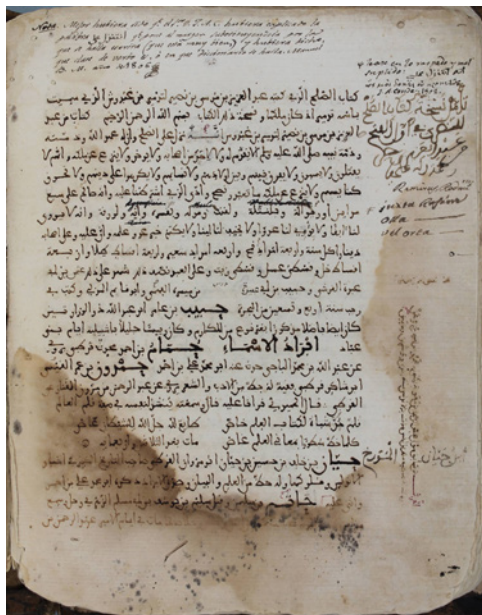
Figura 3 – Pacto de Teodomiro no código de al-D.abbī (1155-1203).