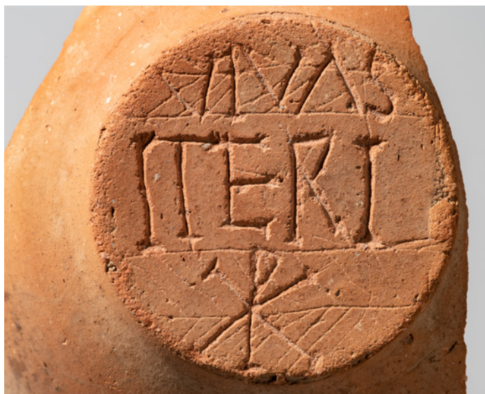
Figura 2 – Fundo de recipiente cerâmico grafitado com a inscrição VIVAS ITERI , crismon e espigas, sugerindo leitura aproximada da expressão “que vivas em Cristo” (Guerra, 2021, p. 111).

A implantação do cristianismo e da estrutura eclesiástica é um dos factores decisivos na transição entre Olisipo e Olysipona (Fernandes, 2020b, p. 146). Embora a diocese de Olisipo existisse pelo menos desde meados do século IV (Alarcão, 1994, p. 63; Coelho, 1994, p. 77), a consolidação do cristianismo e da estrutura eclesiástica terá sido relativamente tardia (Fernandes 2020, p. 146, 148-149). No século VI, já sob domínio visigótico, o cristianismo já era a religião predominante em Lisboa e no seu território de influência (Alarcão, 1994, p. 63; Fernandes, 2020b, p. 146). Esta evolução talvez explique e escassez e pouca expressividade dos contextos religiosos e funerários paleocristãos de Olisipo romana e mesmo tardo-antiga (Fernandes e Fernandes, 2020, p. 224-225).