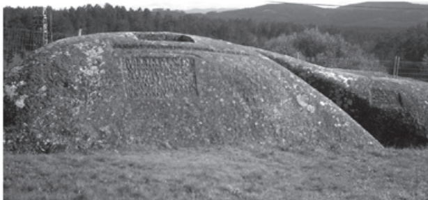
Figura 1 – Fraga de Panóias.