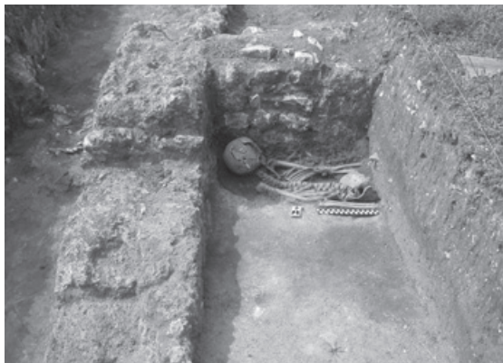
Figura 3 – Sondagem arqueológica a Norte do fórum, zona preferencial de desenvolvimento da investigação arqueológica em Conimbriga na actualidade.

b) Naturalmente, um dos elementos essenciais na estratégia de desenvolvimento do projecto de Conimbriga assenta na investigação arqueológica do núcleo urbano: o seu contributo permite a exposição de novas áreas ao público, enriquece o acervo museológico da instituição, promove a consciência pública sobre o local e aumenta o prestígio científico e académico da instituição. A investigação é, portanto, um pivot fundamental da actividade do Museu (Figura 3).