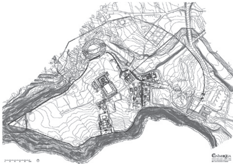
Figura 1 – Planta geral de Conimbriga, © Cruz & Alarcão – MMC/DGPC

actualmente, um dos problemas mais complexos em termos de gestão das ruínas. São bem claras as especificidades de um estabelecimento arqueológico ao ar livre, onde estão presentes estruturas construídas em alvenaria, revestimentos a estuque (por vezes ainda com pintura), pavimentos musivos, etc., sujeitos aos agentes atmosféricos e a amplitudes térmicas que ultrapassam por vezes os 30°C.