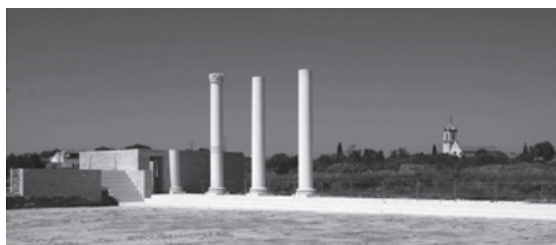
Figura 4 – Intervenção de conservação e valorização no fórum de Conimbriga (Projecto Cruz & Alarcão 1994).

– tratar, do ponto de vista arquitectónico, as coberturas de protecção dos vestígios pré-romanos e a sua relação com os monumentos flavianos, dando a estes a necessária expressão plástica; o exemplo da cobertura da Casa dos Repuxos, na medida em que estabelece um corte com a sua envolvente patrimonial e natural, é bem demonstrativo da potencial perturbação à fruição e à leitura que esse tipo de soluções acarreta. Foi, portanto, indispensável encarar uma intervenção global nos monumentos, necessariamente adaptada às suas dimensões e ao seu carácter monumental intrínseco; a monumentalidade da intervenção foi, assim, de natureza propriamente programática e não é acidental;