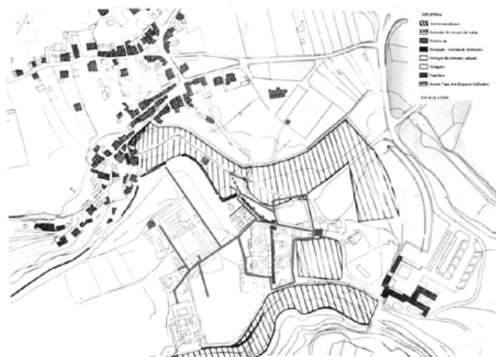
Figura 5 – Projecto de Desenvolvimento Infraestrutural do programa Museológico de Conimbriga. Planta de síntese.

a) a expansão do perímetro das Ruínas para os seus limites naturais, que correspondem aos limites antigos da cidade;